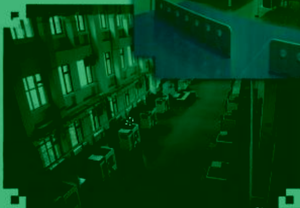
DMG 数控技术 训练场所