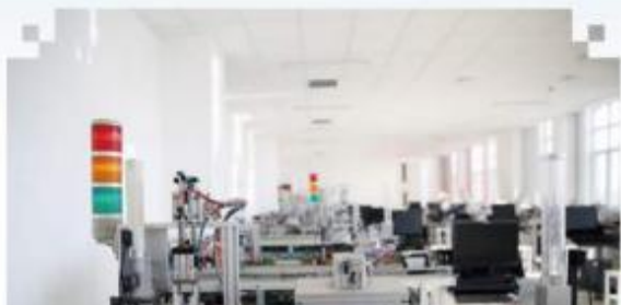
自动化生产线安装与 调试训练场所